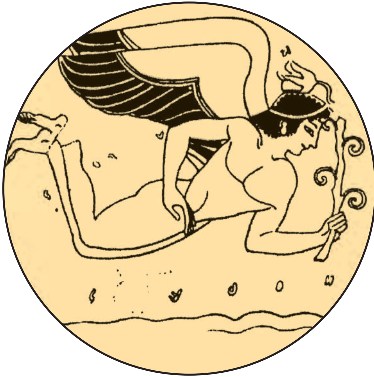
«Ἔρως ἰπτάμενος». Ἐρυθρόμορφη ἄττική κύλιξ. (Μουσείο Σίβικο, Φλωρεντία.)

μπει ἐξ ἔρωτος εἰς τὸ αἰθερικὸν διάστημα, ὅταν μετὰ ἀπὸ ἐπίπονες προσπάθειες καταφέρει νὰ ἀνέλθῃ καὶ νὰ φθάσῃ στὴ θύρα τῶν ἀνακτόρων.