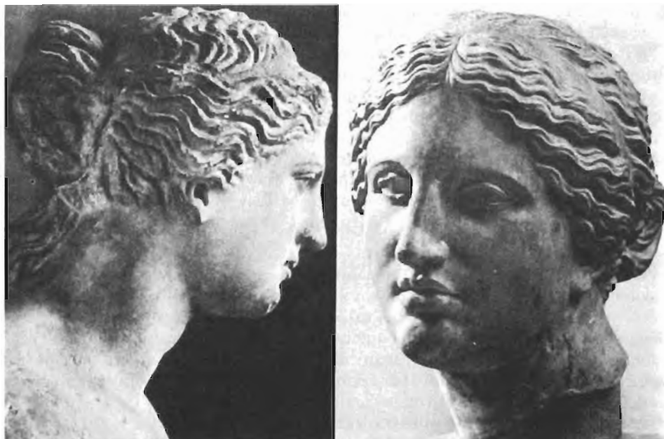
Άριστερά: Η κεφαλή του περιφήμου αγάλματος της Άφροδίτης της Μήλου και δεξιά η κεφαλή της Κνωδίας Άφροδίτης, που εύρίσκονται στο Λούβρο των Παρισίων.